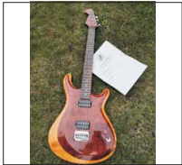
008 - [Elektrisch] Poldi's Gitarre- @Poldi