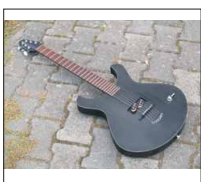
021 - [Elektrisch] Das hohle Ding aus dem Baumarkt- @cabriolet