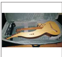
016 - [Akustisch] Harfengitarre- @glambrmbasler