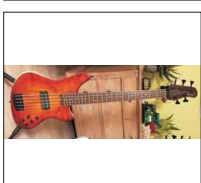
024 - [Elektrisch] Panthera Custom 5-String Bass- @zappl