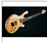
039 - [Elektrisch] Homegrown Bavarian Blonde- @Rallinger