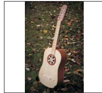
030 - [Akustisch] Die Barockartige- @glambrmbasler