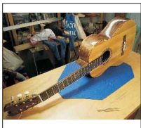
011 - [Akustisch] Konzertgitarre aus Recyclingholz- @sven2