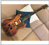
005 - [Kopie] Babysnakes SG @hansg