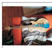
042 - [Elektrisch] "Laguna"- @Niko1909