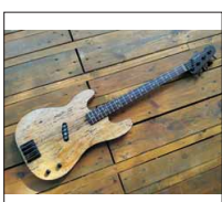
023 - [Elektrisch] Reverse P-Bass "Räudiger Rüdiger"- @zappl