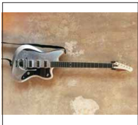
009 - [Recycling] Offset Bariton Thinline "Silver Jetmaster"- @DoppelM