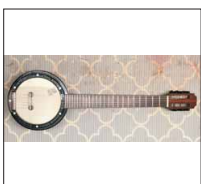
017 - [Akustisch] Cümbüs- @Yaman