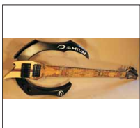
013 - [Elektrisch] Osmium (Shitstorm)- @thoto