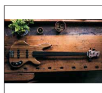
048 - [Elektrisch] J-Fretless Bass- @Niko1909