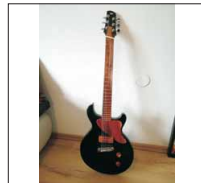
038 - [Recycling] Die Familiengitarre- @Lollipop