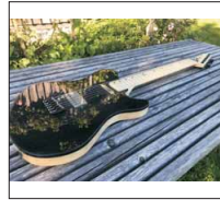
033 - [Elektrisch] Snow White- @filzkopf