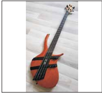
006 - [Elektrisch] Kaizen Bass- @ugrosche