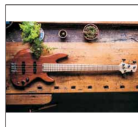
040 - [Elektrisch] J-Style-Bass "Bubi"- @Niko1909