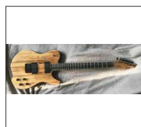
044 - [Elektrisch] JET: Jackhammer's Enhanced Telecaster- @Jackhammer