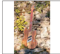
035 - [Elektrisch] Fächerreptil- @ChrisPbacon