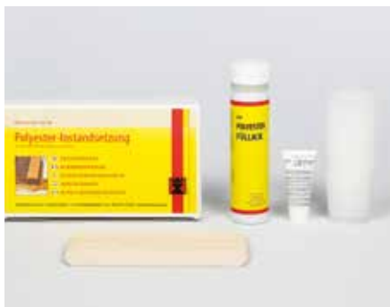
Abbildung: 641 020

Zum Entfernen von Kratzern, Druckstellen und Löchern auf polyesterbeschichteten Möbel- und Pianoteilen durch Auffüllen, Abtragen, Schleifen und Polieren. Für den Innenbereich.